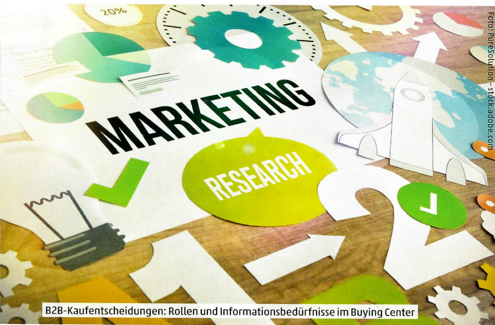
B2B-Kaufentscheidungen: Rollen und Informationsbedürfnisse im Buying Center

Wie sich durch klar definierte Rollen im Buying Center die Kaufentscheidungen im B2B-Bereich positiv beeinflussen lassen